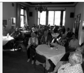
(Abb. 4) Der Weyermansaal war voll besetzt und das Interesse an der Leichlinger Geschichte groß