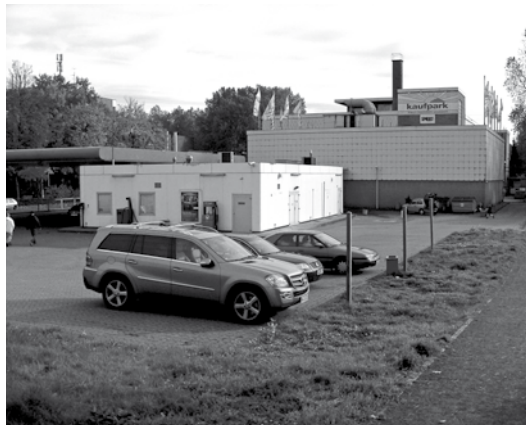
(Abb. 1) Nicht gerade die schönste Ecke Leichlingens: Die unpassende und in die Jahre gekommene Bebauung mit Kaufpark und Tankstelle dicht am Wupperufer...

Trotz dieser Schwierigkeiten ist es endlich im Schulterschluss mit Bürgermeister Frank Steffes gelungen, Grundsatzfragen gemeinsam politisch zu beschließen und noch in diesem Jahr eine Bürgerbefragung durchzuführen. Die Leichlingerinnen und Leichlinger sollen nun entscheiden, ob einer der Parks für die Stadtentwicklung zur Verfügung steht und damit die Öffnung zur Wupper möglich werden kann. ... (Fortsetzung auf Seite 2)