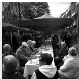
(Abb. 3) Gemütliches Beisammensein beim Maischoppen

Interessiert beteiligten sich die anwesenden Bürgerinnen und Bürger an der folgenden Diskussionsrunde und erzählten auch von eigenen Erfahrungen und Geschichten. ■